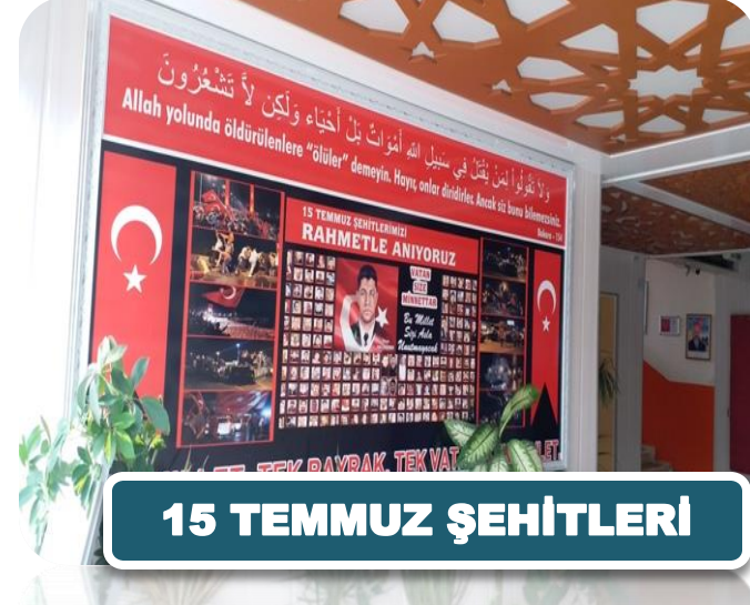
15 TEMMUZ ŞEHİTLERİ